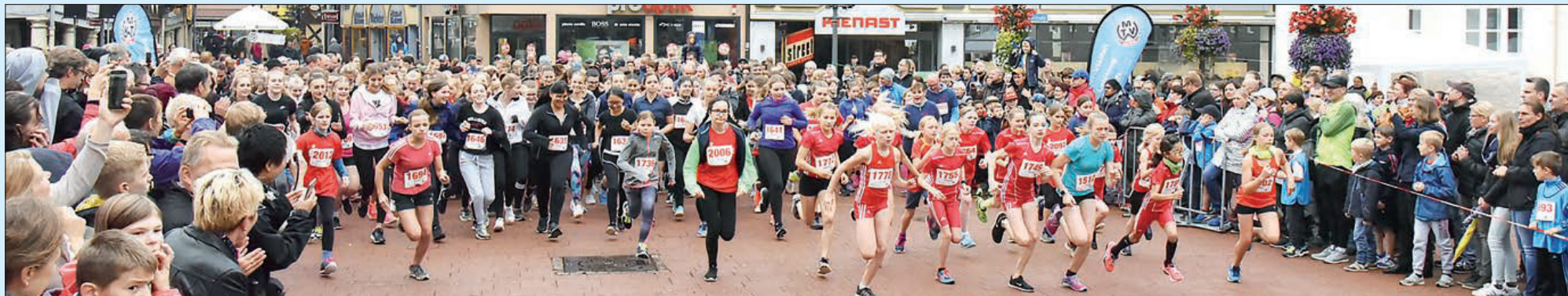
Startschuss des 2,5-Kilometerlaufs der weiblichen Teilnehmer.