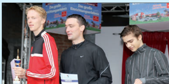
Siegerehrung für den 5-km-Lauf: Die Plätze 1 bis 3 der männlichen Teilnehmer.