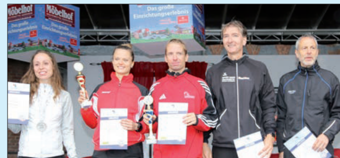
Siegerehrung für den 10-km-Lauf: Die Plätze 1 bis 3 der männlichen sowie Platz 1 und 2 der weiblichen Teilnehmer.