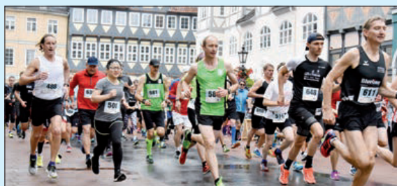
Gerade wurde der 10-km-Lauf mit einer großen Teilnehmerzahl gestartet.

Wolfenbüttel. „Tolle Atmosphäre, gute Stimmung, sympathische Strecke, hervorragende Organisation.“ Dies waren die wesentlichen Bemerkungen, die die Organisatoren rund um den Wolfenbütteler Stadtlauf immer wieder zu hören bekamen. Der Umzug vom Veranstaltungsgelände Schloss auf den Stadtmarkt ist somit erfolgreich vollzogen und wird mit Sicherheit auch im nächsten Jahr Bestand haben. Dass dieses alles so hervorragend umgesetzt werden konnte, ist der Unterstützung der Stadt Wolfenbüttel, den Sponsoren und den zahlreichen Helfer geschuldet. Am letzten Sonntag haben insgesamt 140 ehrenamtliche Helfer des MTV Wolfenbüttel dafür gesorgt, dass rund um den Stadtmarkt, auf der Strecke und den Verkehrspunkten alles reibungslos gelaufen ist. Diesen Helfern und Unterstützern gilt der Dank genauso, wie den Sponsoren des Stadtlaufes, die es erst möglich machen, dass in dieser Qualität ein Lauf in so einer Größenordnung durchgeführt werden kann. Die Belohnung ist sicherlich auch, dass man mit 1.894 gemeldeten Läufern wieder einen neuen Teilnehmerrekord in diesem Jahr verzeichnen konnte.