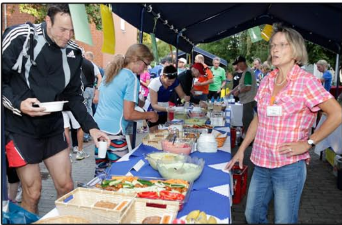
Am Ende ein Büfett der Sonderklasse

Das BlueLiner-Team hatte wieder einmal ganz viel Spaß und war im Ziel begeistert von der Strecke und der Veranstaltung. Neue Eindrücke von den Menschen, um die es bei diesen Lauf ging, werden in steter Erinnerung bleiben.