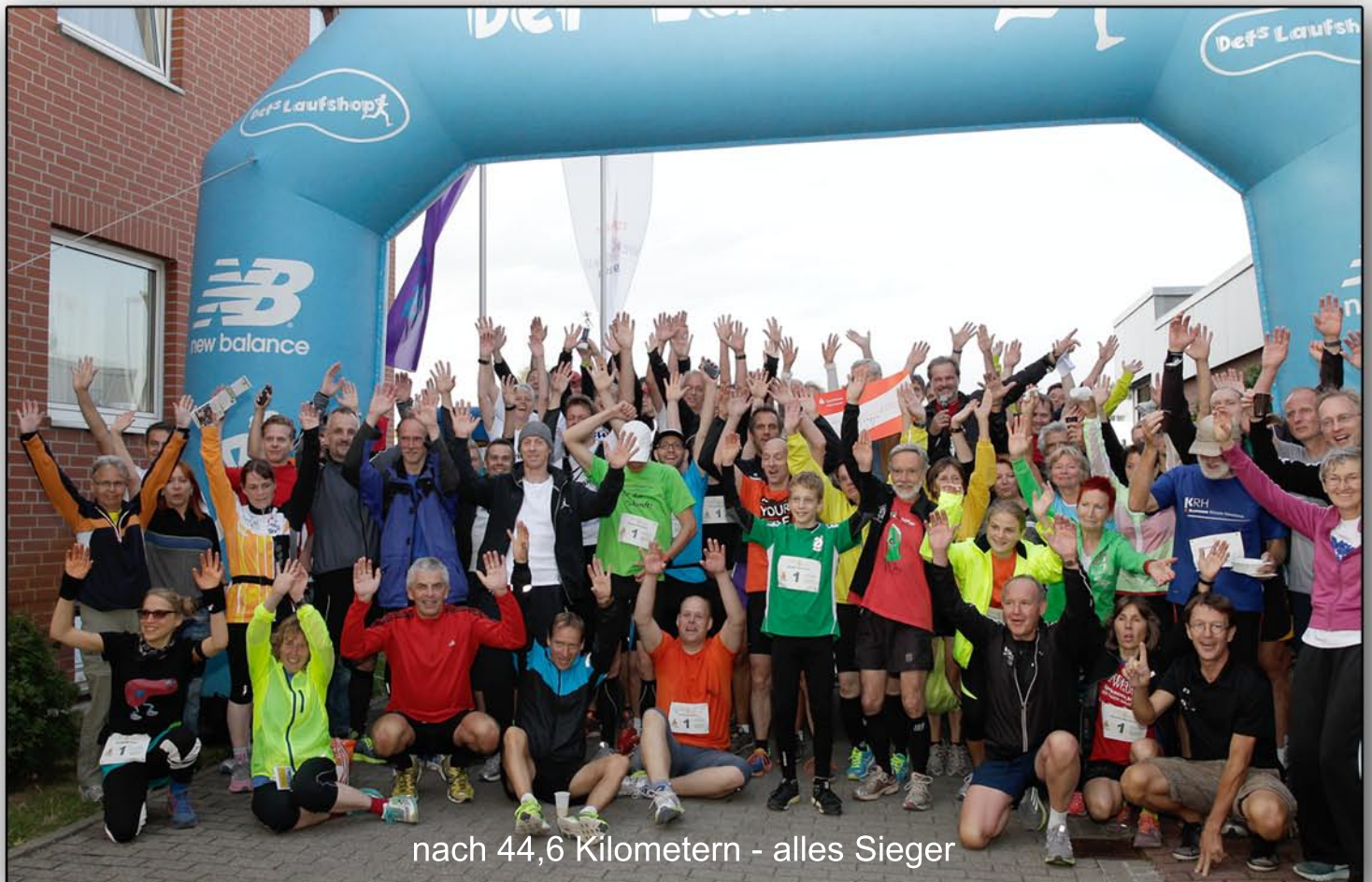
nach 44,6 Kilometern - alles Sieger