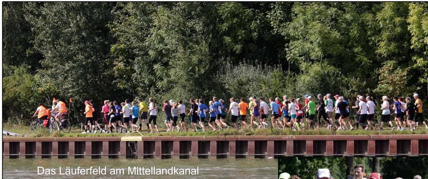
Das Läuferfeld am Mittellandkanal

Alle Teilnehmer trugen die Startnummer EINS, waren gleichwertig im Feld. Das Tempo wurde von erfahrenen Pacemakern und den Fahrradbegleitern gemacht. Willi mußte, verletzungsbedingt, mit dem Fahrrad begleiten. Unglücklicher Weise gab es bei Kilometer 10 einen Platten auf beiden Reifen. Der muß wohl durch einen Glascontainer gefahren sein. Der größte Teil der Laufstrecke verlief durch die grüne Lunge der Stadt. Mittellandkanal, die Leineauen, der Stadtwald Eilenriede, lagen auf der 44,6 Kilometer langen Laufstrecke.