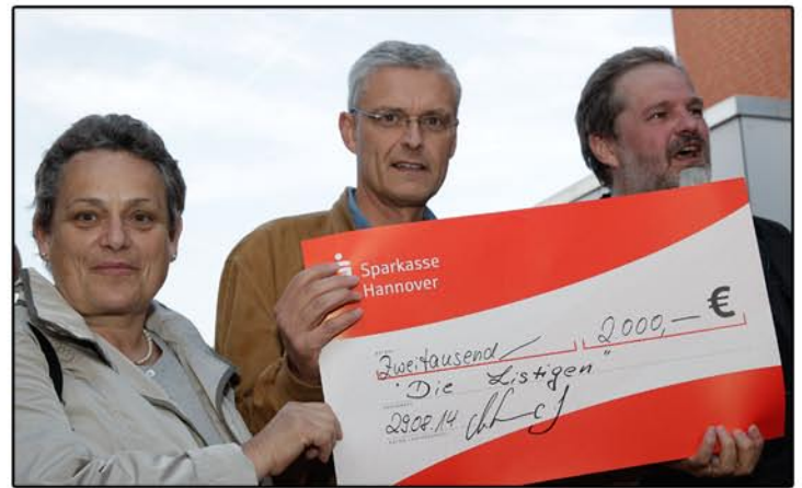
Zweitausend Euro wurden gespendet