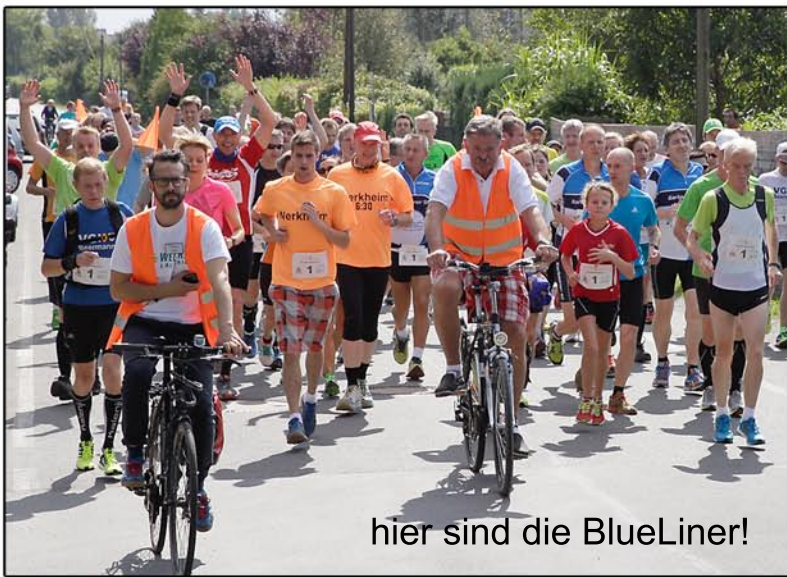
hier sind die BlueLiner!