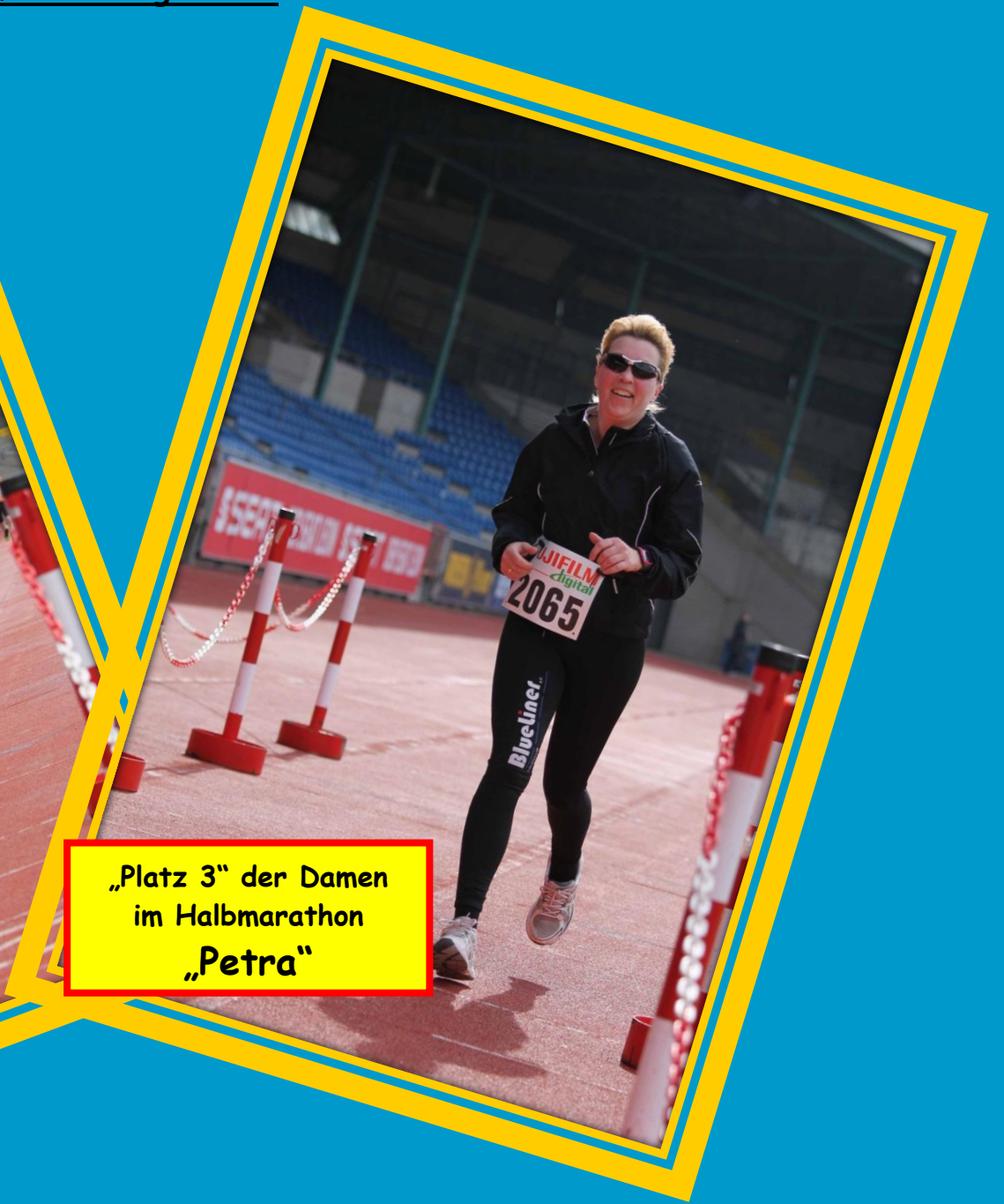
„Platz 3“ der Damen im Halbmarathon „Petra“