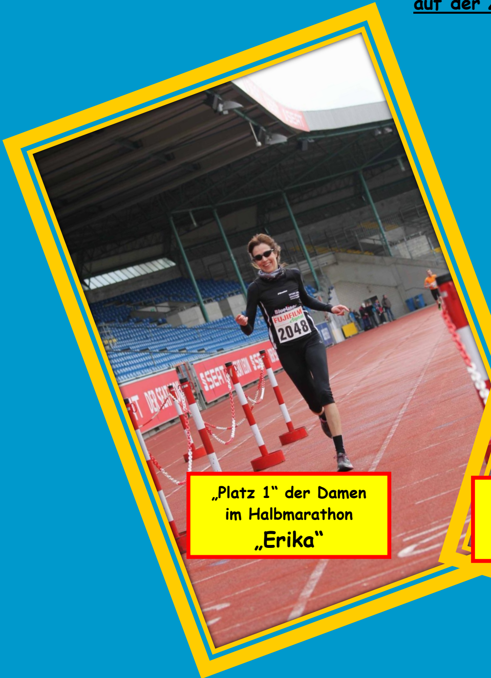
„Platz 1“ der Damen im Halbmarathon „Erika“