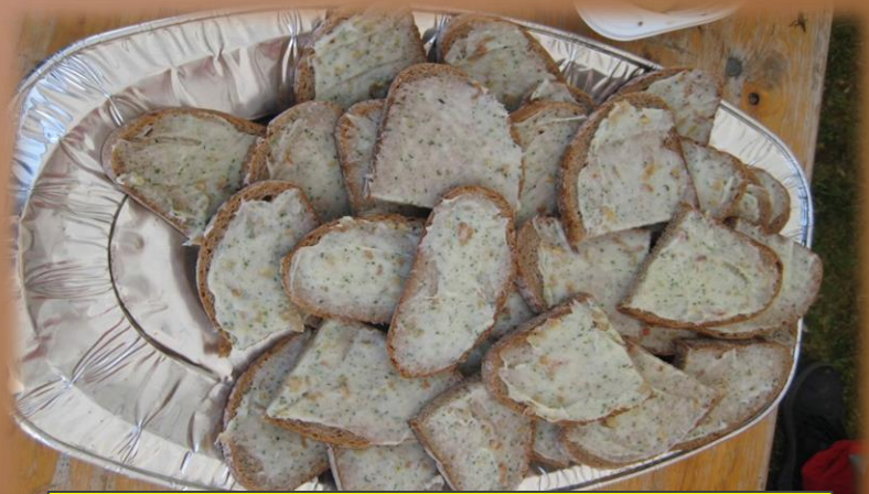
...mit dem Highlight von Schmalzbrot!!!