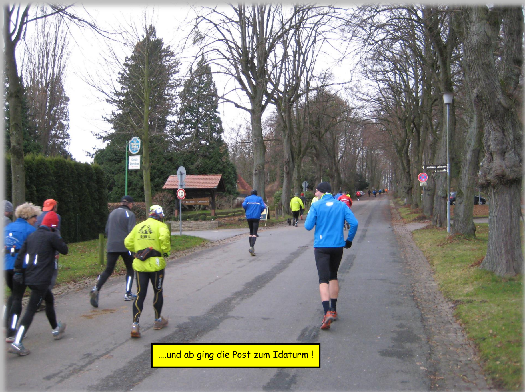
....und ab ging die Post zum Idatum !